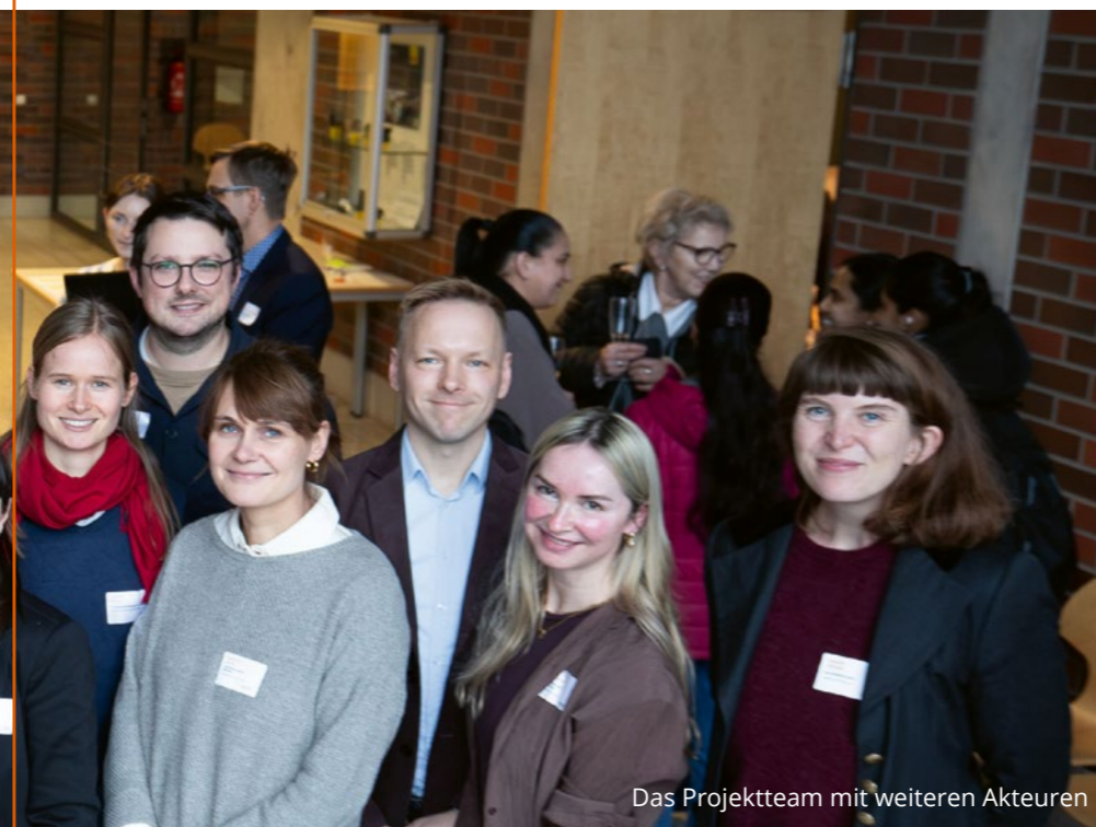
Das Projektteam mit weiteren Akteuren